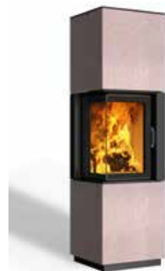
Minh 38 Beton terra