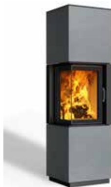
Minh 38 Beton hell