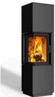
Minh 38 Stahl